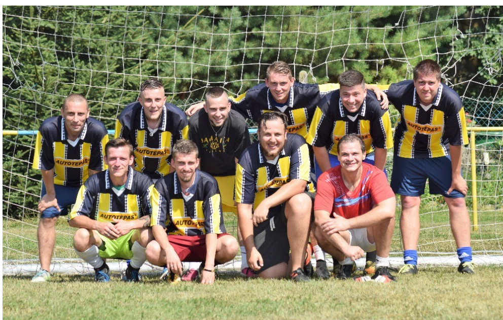
Beer Team Kladno